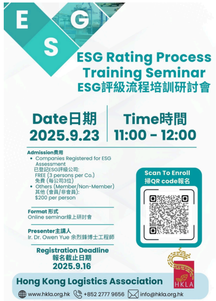
ESG Rating Process Training Seminar (23 September 2025)