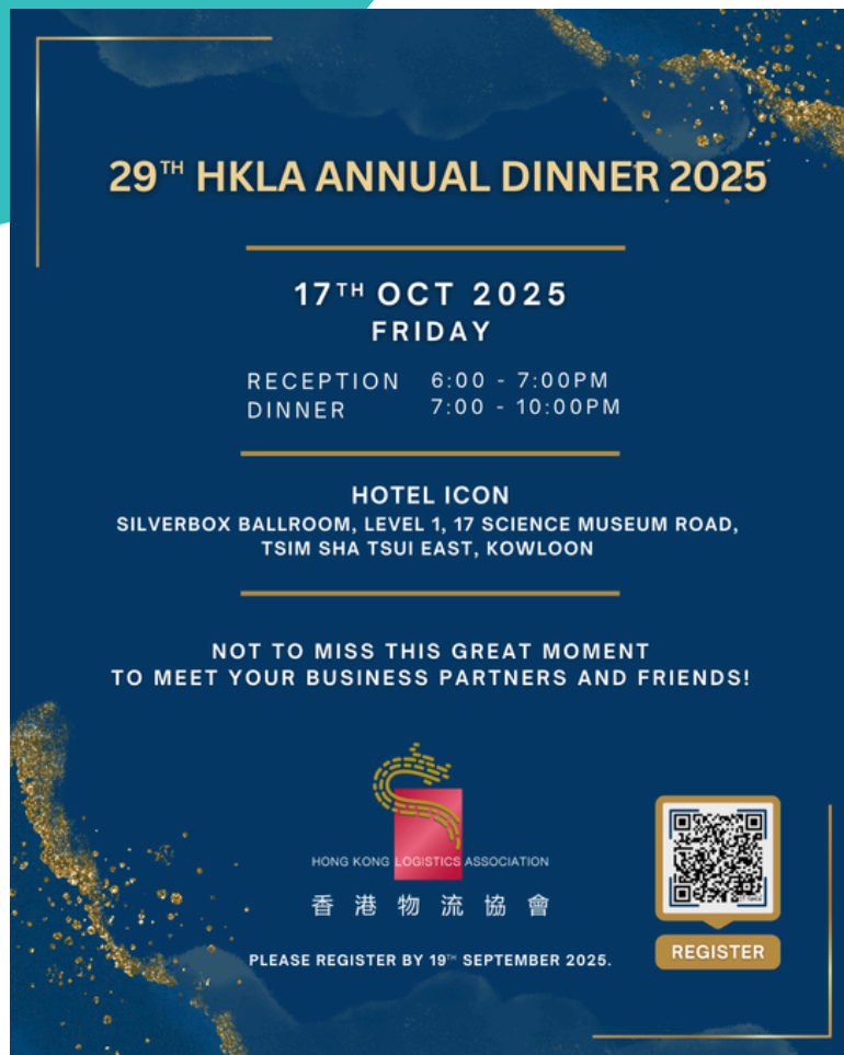
29TH HKLA ANNUAL DINNER (17 October 2025)