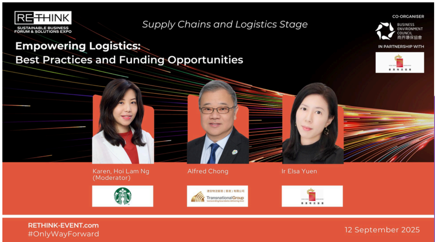
RethinkHK Supply Chains and Logistics Stage (12 September 2025)